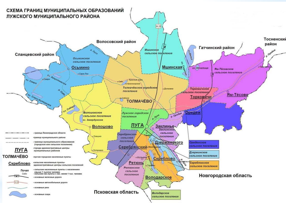
СХЕМА ГРАНИЦ МУНИЦИПАЛЬНЫХ ОБРАЗОВАНИЙ ЛУЖСКОГО МУНИЦИПАЛЬНОГО РАЙОНА

Володарское Волошовское Дзержинское Заклинское Мшинское Оредежское Осьминское Ретюнское Серебрянское Скребловское Торковичское Ям-Тесовское